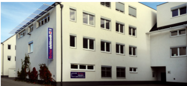
Wien - Österreich