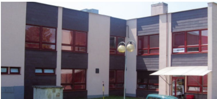
Trencin - Slowakei

Schnell suchen - schnell finden! Genießen Sie unseren Online-Komfort: Auf www.fischerelektronik.de finden Sie ein detailliertes Gruppensortiment für unsere drei Hauptbereiche: Kühlkörper Gehäuse Steckverbinder Unsere Suchanfrage: Suchwörter oder Artikelnummer helfen Ihnen bei der zügigen Auswahl.