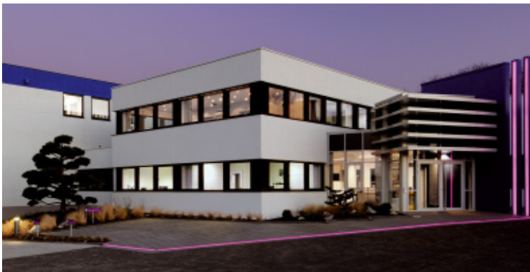
Lüdenscheid - Deutschland